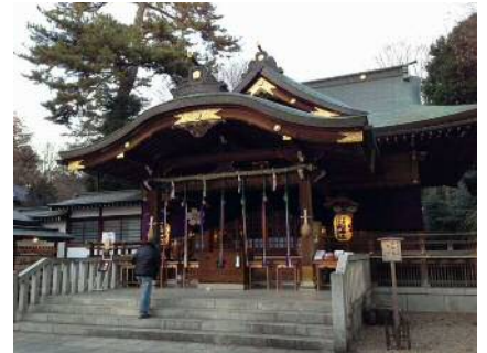
布田天神 2013年1月4日撮影

税理士法人シンフォニア 182-0026 東京都調布市小島町 2-45-22 ワイズビル 202