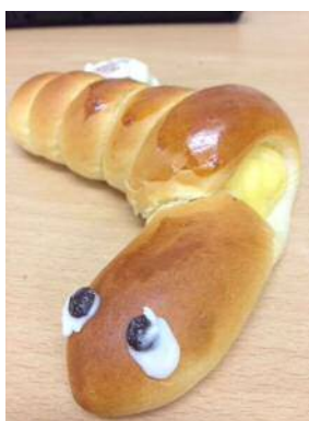
巳年パン 調布天神通りのパン屋で購入1月4日