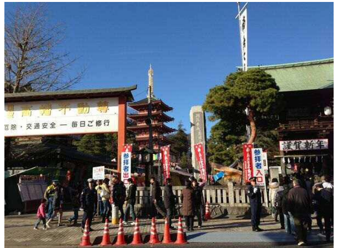
(高幡不動(日野)にて 2013年1月1日撮影)

この1月から実務的にすぐに対応すべきなのは、給与所得の源泉徴収、報酬等の源泉徴収になります。これまで